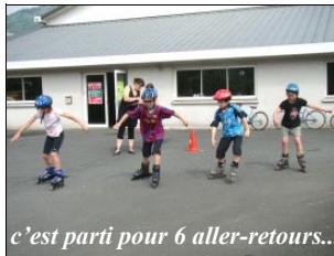
c'est parti pour 6 aller-retours...

Mais pour avoir une médaille de décathlon, il faut réaliser dix tests sportifs. Retrouvons les enfants sur l'atelier de course à roller... Très discriminant mais il y a des spécialistes et un très bon esprit d'équipe et d'entraide ! L'important, c'est de participer , et avec le sourire et beaucoup de détermination.