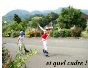
et quel cadre !