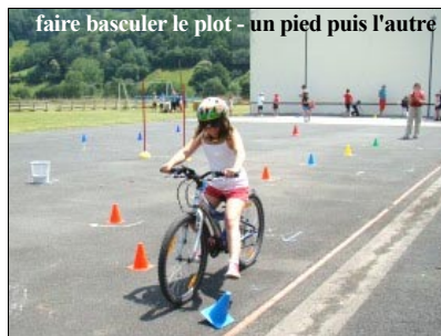
faire baseuler le plot - un pied puis l'autre