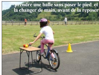
prendre une balle sans poser le pied et la changer de main, avant de la reposer