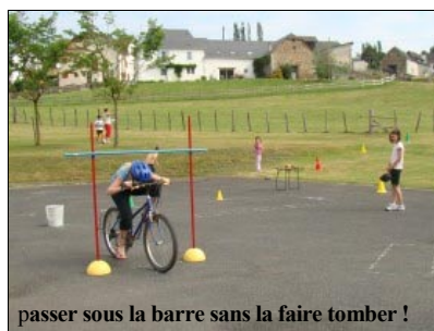
passer sous la barre sans la faire tomber !