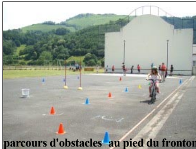
parcours d'obstacles - au pied du fronton

Pour le test il faut enchaîner 10 sauts à l'endroit, puis 10 sauts à l'envers, 10 sauts sur un pied et 10 sauts en croisant les bras. FA-CI-LE... pour "presque" tous !