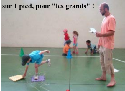
sur 1 pied, pour "les grands" !