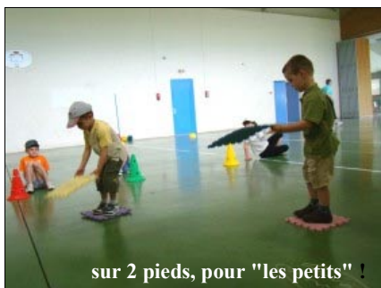
sur 2 pieds, pour "les petits" !