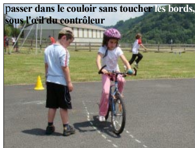
passer dans le couloir sans toucher les bords, sous l'œil du contrôleur