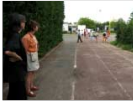
Lancer d'une balle de tennis, avec ou sans élan dans un couloir jalonné tous les 50 cm. La mesure est prise à l'endroit où la balle touche le sol.