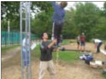
Test difficile pour les enfants qui ne pratiquent pas souvent cette activité à l'école, mais ils sont très encadrés... et tellement fiers !