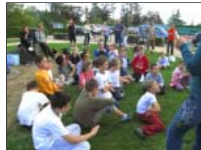
Beaucoup d'attention pour la proclamation des résultats et la remise des récompenses...