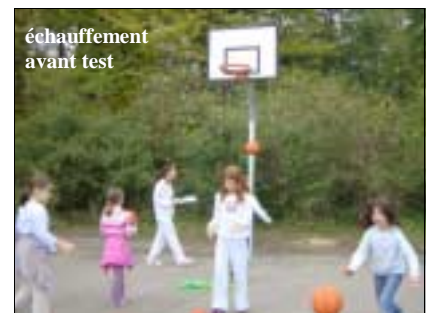
échauffement avant test